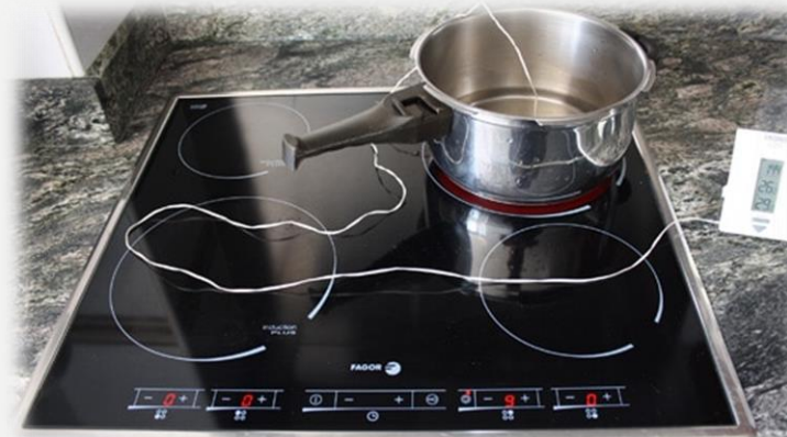
Vitro-cerámica de inducción